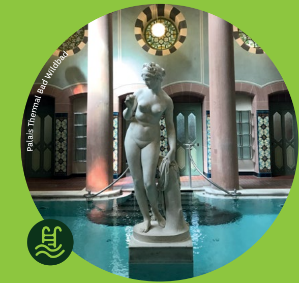
Palais Thermal Bad Wildbad

Übrigens: Alle Rad- und Wanderrouten sind optimal an den ÖPNV angebunden. Ein besonderer Service bietet der regionale Verkehrsverbund VVS, denn in allen Stadt- und S-Bahnen können Fahrräder mitgenommen werden.