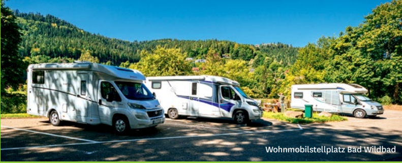
Wohnmobilstellplatz Bad Wildbad

Wer die App heruntergeladen hat, profitiert von vielen weiteren nützlichen Funktionen. So können Fahrgäste mit „VVS mobil“ unter anderem ihre persönliche Verbindung in Echtzeit abrufen, bekommen Meldungen zu Störungen und Baustellen und können in der Live-Karte nach der nächsten Fahrradverleihstation Ausschau halten.